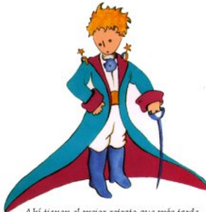
Ahí tienen el mejor retrato que más tarde logré hacer de él

Me puse en pie de un salto como herido por el rayo. Me froté los ojos. Miré a mi alrededor. Vi a un extraordinario muchachito que me miraba gravemente. Ahí tienen el mejor retrato que más tarde logré hacer de él, aunque mi dibujo, ciertamente es menos encantador que el modelo. Pero no es mía la culpa. Las personas mayores me desanimaron de mi carrera de pintor a la edad de seis años y no había aprendido a dibujar otra cosa que boas cerradas y boas abiertas.